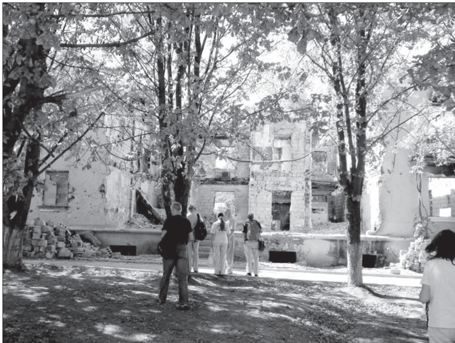
Разрушенное здание в центре поселка Мироновский

ре прямых попаданий в дома не было, но около 50 домов получили повреждения крыш, стен, разбиты окна. Сейчас есть безотлагательная потребность в шифере — нужно около 1000 листов.