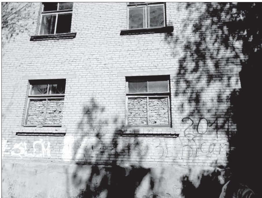
Школа № 2 в пгт Мироновское. Обстрелы были в январе 2015 года