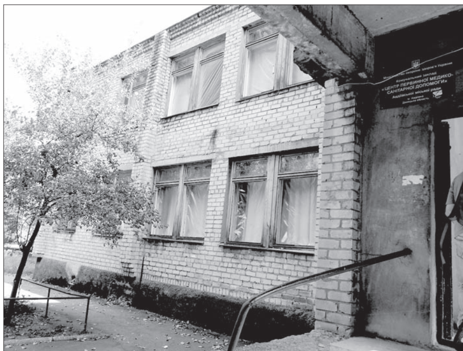
Здание больницы и поликлиники в Авдеевке. Стекол нет. Рядом со входом можно найти металлические осколки от разорвавшихся снарядов или мин

В Авдеевке также имеется одна больница, которая обслуживает всю Авдеевку. Больничный комплекс современной постройки является достаточно большим, но сейчас в нем работает очень мало врачей и точно так же мало больных находятся на лечении.