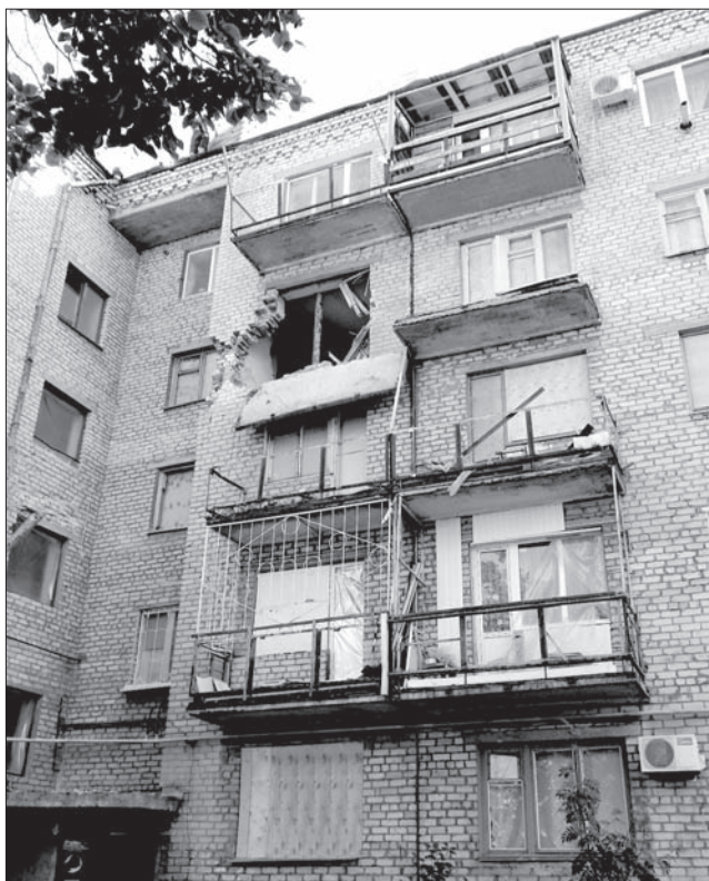
Попавший под обстрел жилой дом в пгт Мироновское пока не отремонтирован