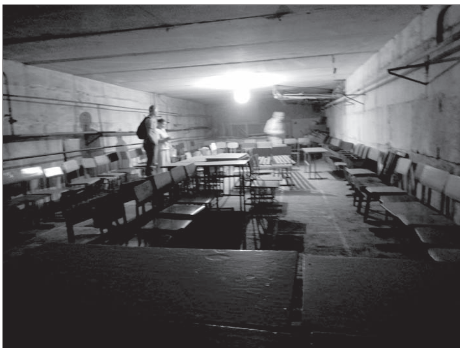
Школа № 7 в Авдеевке. Окон нет, во дворе можно найти осколки от снаряда. Подвал школы оборудован для проведения в нем занятий

В прошлом году учебный процесс не был начат вовремя, так как были постоянные обстрелы города. Главный вопрос учебного процесса для городского Головы — это безопасность. Поэто-