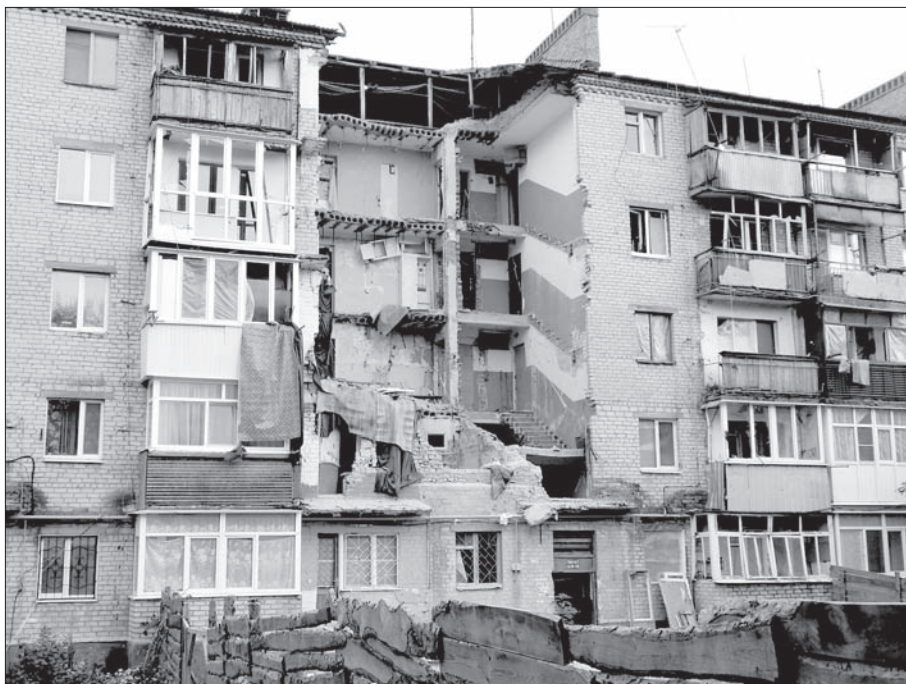
Разрушенный подъезд дома в г. Славянск

Уже после визита мониторинговой группы, 9 сентября 2015 года из Славянска сообщили о том, что люди, чьи дома пострадали, смогут получить компенсации из местного бюджета. На это выделено 400 тысяч гривен (около 16 тысяч евро). Помощь будет выделена до конца года. Сумма единовременного пособия еще не определена. Дом по ул. Бульварная, 4 требует ремонта на сумму 4 млн. гривен.