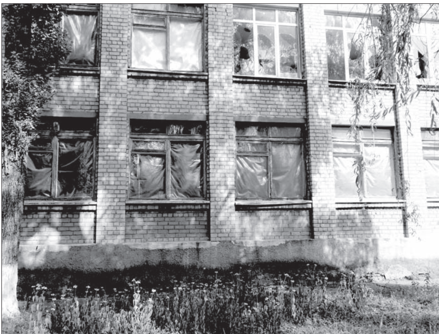
Школа № 5 в г. Авдеевке пострадала при обстрелах.

На территории сельсовета 2 школы, одна в Первомайском, одна в Нетайлове. Обе школы повреждены обстрелами, но 1 сентября приняли учащихся. В Первомайскую школу 1-го сентября пришли 73 ребенка, а до начала военных действий в школу ходили более 100 человек. Учителя, которые уже собирались домой, вернулись в школу, чтобы показать ее нам и рассказать о школе и о пережитом за год. Учителя сообщили, что в школе ремонт требовался еще в мирное время — у них есть даже план реконструкции. Надеются, что с наступлением мира план будет ре-