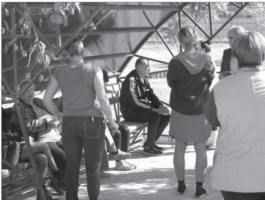
Святогорск. Пансионат, в котором проживают ВПО с Горловки, Дебальцево, Авдеевки, Мироновки. Встреча с мониторами

Острая проблема с жильем: нет мест для размещения ВПЛ. Жилье они ищут сами. Стоимость аренды однокомнатной квартиры — 1,5–2 тыс. гривен в месяц. Хотя многие подали