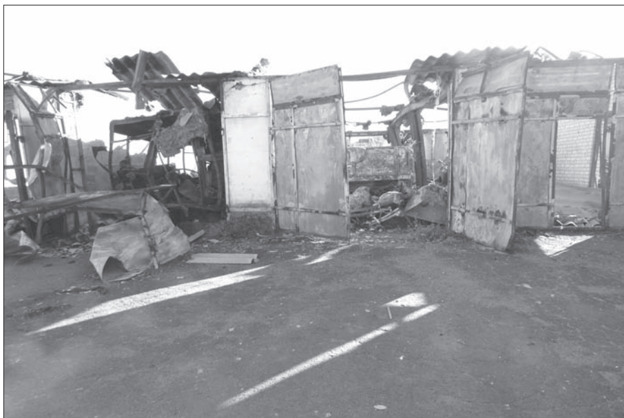
Фото больницы в Красногоровке — последний обстрел был 24.08.2015