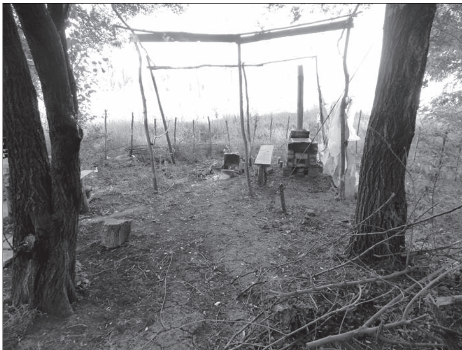
Фото места для приготовления пищи на дровах возле многоэтажного жилого дома, где жители готовят себе еду

Школа частично пострадала в результате артобстрелов. 7 февраля было попадание в крышу, вылетели стекла.