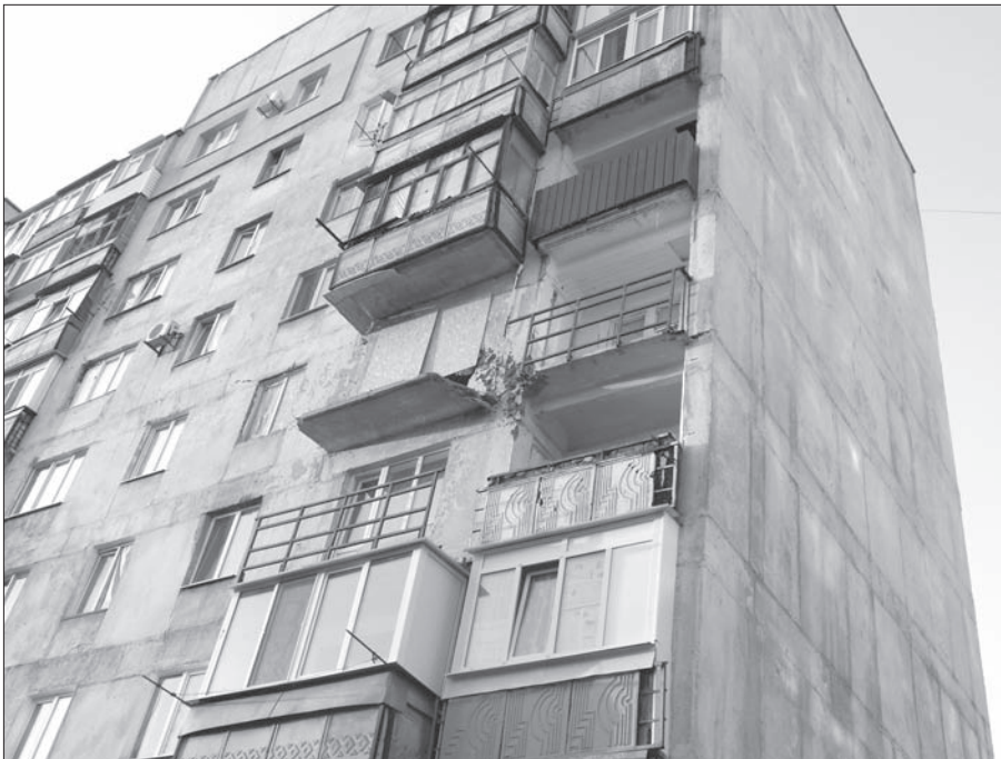
фотография с МКР «Восточный» — дом с квартирой на пятом этаже, в которую попал снаряд

Посещение микрорайона Восточный подтвердило разрушения. Не все дома еще восстановлены: необходим ремонт лифтовых шахт, подъездов, в некоторых квартирах до сих пор окна забиты досками, пленкой и т. д. Но школа отремонтирована. А вот детский сад еще не отремонтирован, и детей он не принимает.