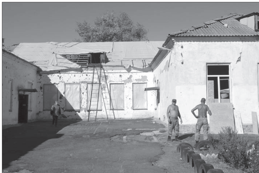
Фото школы № 3 в Красногоровке, разрушенной 13 снарядами. Солдаты помогают ремонттировать здание

В школе № 3 в настоящее время насчитывается 40 учащихся — они ходят учиться в школу № 5, где им выделили на втором этаже несколько классов, и педагоги их школы продолжают их обучать в помещении школы № 5.