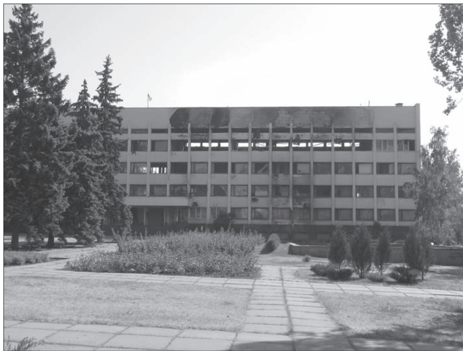
Фото сожженного горсовета в Мариуполе

Таким образом, представляется очевидным, что на площади имеет место противостояние сторонников единой Украины с поддерживающими «Донецкую народную республику» и Путина. Также является очевидным, что поддерживающие «Донецкую народную республику» у Путина собираются здесь регулярно.