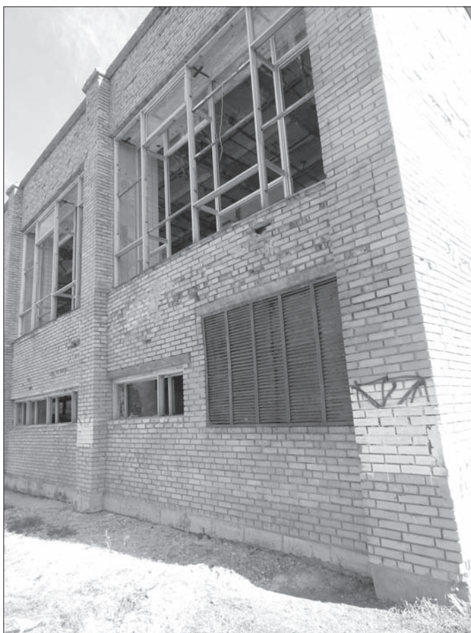
Два фото разрушенных зданий в Марьяновке (жилой дом и школа № 1)

В 2014 году была попытка вывезти школу-интернат для детей-сирот, находившуюся в Марьинке, в Россию. Но все 54 ребенка после переговоров омбудсменов России и Украины вернулись в Украину. Позже в школе стояли украинские военнослужащие. В июне 2015 года здание школы было серьезно повреждено и в настоящее время не может использоваться.