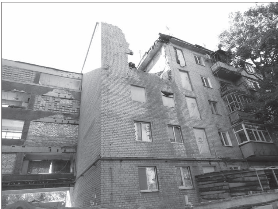
фото разрушенного здания по адресу ул. Пархоменко, 7