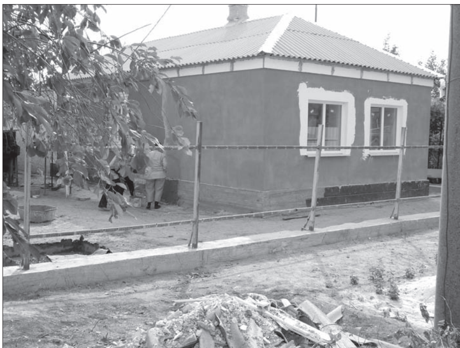
Разрушения в юго-восточной части Сартаны (ул. Красноармейская)

Далее выделяется помощь со стороны местного самоуправления. На восстановление Сартаны