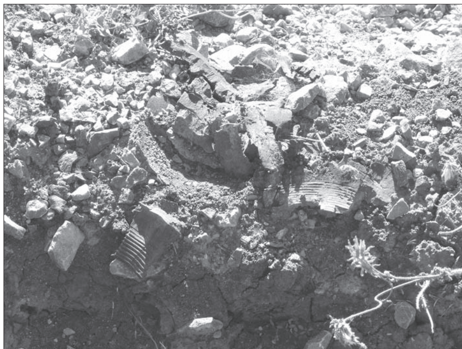
Фото со двора школы № 1 — остатки разорвавшегося снаряда

В Красногоровке были обнаружены множественные разрушения, среди них: