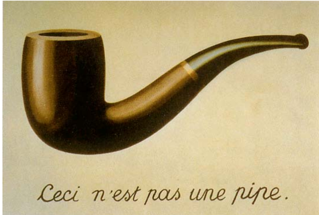
René Magritte: „Ceci n'est pas une pipe“ 1

Dies ist keine deutsch-russische Tagung!