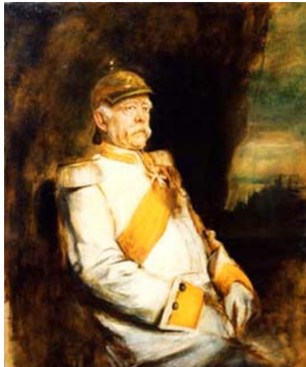
Franz von Lenbach: „Bismarck“ um 1900

Ich kann Ihnen versichern, wir hatten selten eine so breit gefächerte Repräsentation zweier Gesellschaften wie in diesem Jahr. Vor allem aber war selten eine solche Spannweite an Generationen vertreten. Ich freue mich, dass Sie alle gekommen sind.